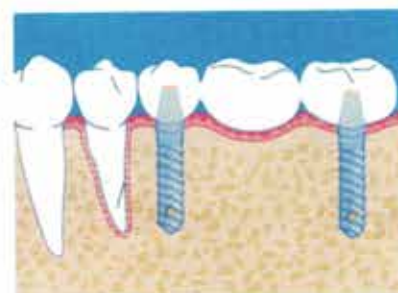
Ponte su impianti